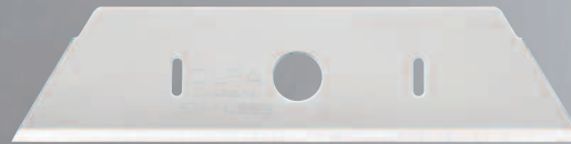
SKB-2S (profondeur de coupe de 15,5 mm/0,61 po)

Voir à l'adresse suivante pour des instructions de nettoyage, et de changement de lame :