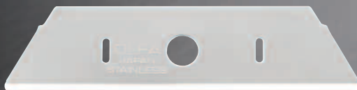
SKB-2S-R/10B (profondeur de coupe de 14,5 mm/0,56 po)